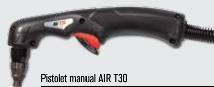
Pistolet manual AIR T30