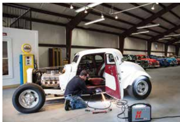
Reparații și modificări auto