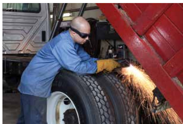
Reparații și modificări auto