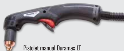
Pistol manual Duramax LT