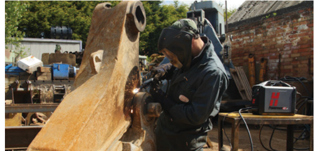
Întreținere și reparații